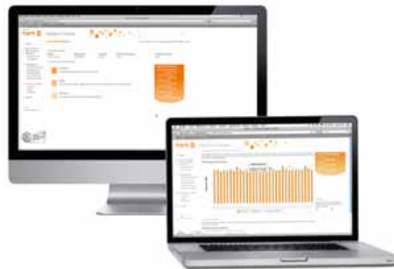
Hier haben Sie Ihren Verbrauch auf dem Schirm: die Smart Meter Online-Auswertung.

Auch Cleverness ist Typfrage. Deshalb erhalten Sie die Smart Meter-Tarife sowohl für KlimaFair Strom als auch für Top Strom. So können Sie weiterhin, wie gewohnt, den Strom Ihrer Wahl nutzen und gleichzeitig von den Vorteilen des Smart Meterings profitieren.