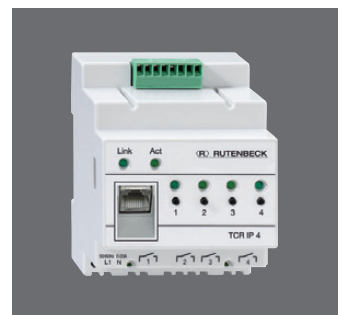
TCR IP 4 700 802 610 REG-Gehäuse 4 TE; lichtgrau (ähnlich RAL 7035); 72 x 90 x 65 mm; 298 g