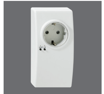
TC IP 1 700 902 610 reinweiß (ähnlich RAL 9010); 66 x 136 x 76 mm; 170 g